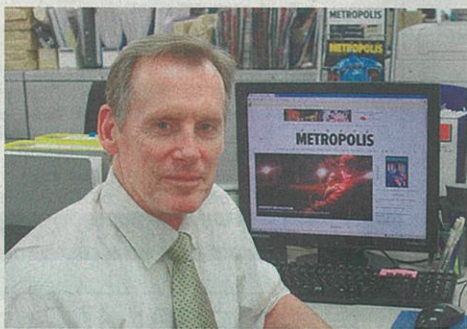
1958年、オーストラリア・メルボルン生まれ。豪モナッシュ大卒業。その後、日本に在住。マネジメントや事業開発に携わり「オージービーフ」ブランドを発案し、普及させた。日本で発行する英字情報誌「Metropolis(メトロポリス)」の最高執行責任者(COO)に2009年就任。日本と世界との懸け橋を目指し世界に日本の情報を発信している。

日本に住んだ経験のない 外国人にとって、日本に対 する認識はきわめて単純で 画一的です。たとえば、容 姿は皆同じに見える、女性 は和服を着る、おすしを食